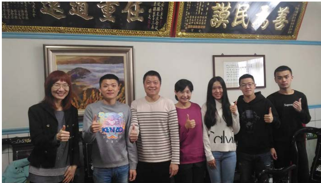
訪視學生實習狀況