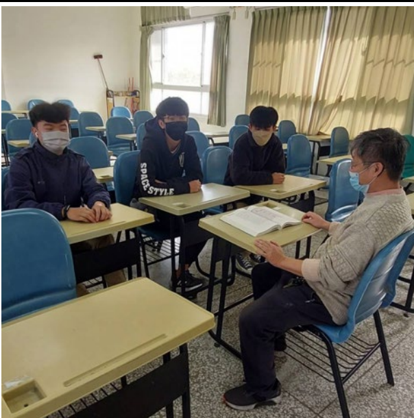
導師和本班同學分享自身的成長經驗