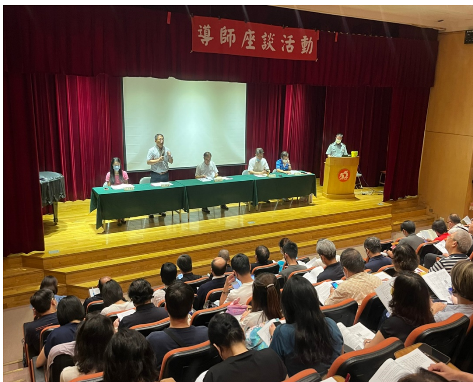
陳校長暨行政主管出席會議