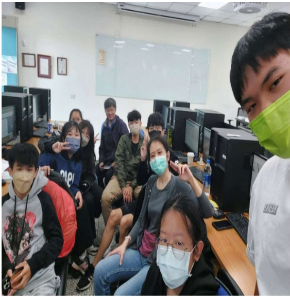
帶領同學參加黑客松競賽時的討論會。