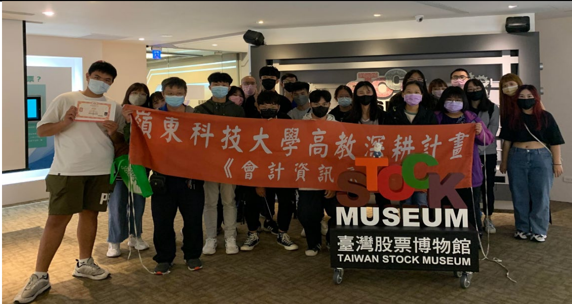
校外參訪，參訪地點台灣股票博物館