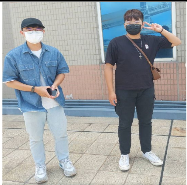
校外參訪：地點-關務署台中關