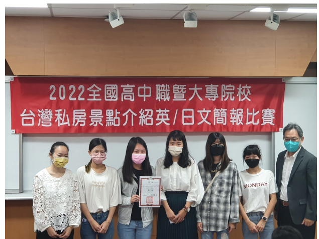
指導學生競賽獲獎