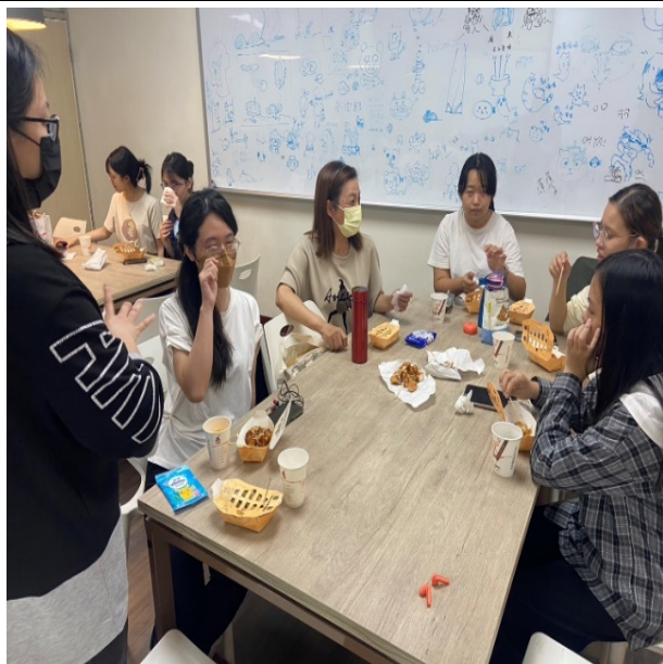
班級經營-聖誕節活動