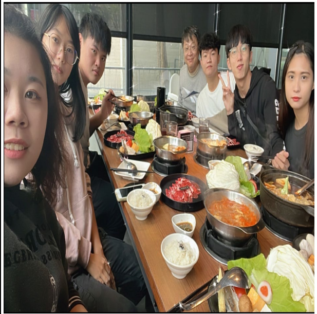
班聚：導師和同學在輕井澤聚餐