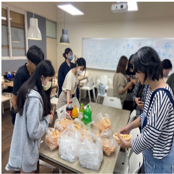
班級經營-聖誕節活動